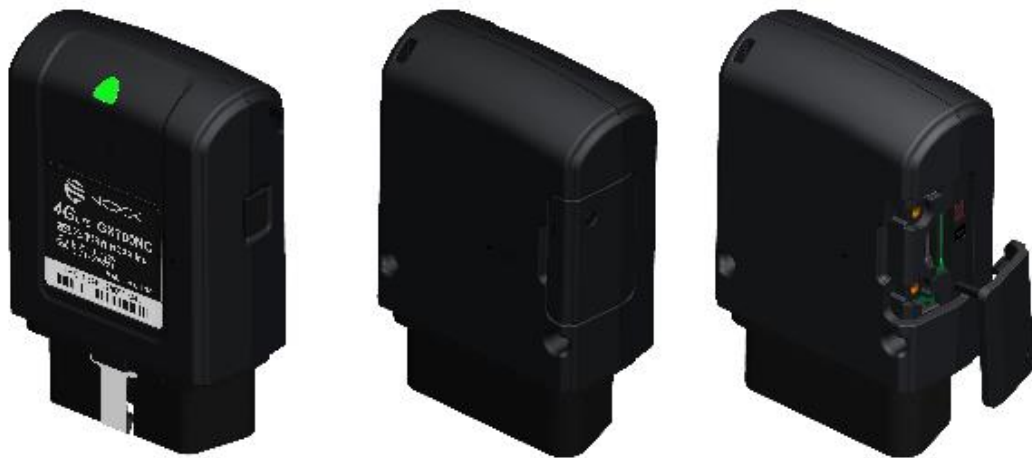
GX700NC（OBD II データ通信端末）