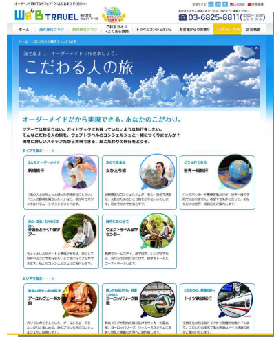
ウェブトラベルのホームページ